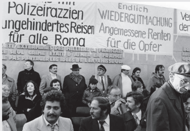
Gedenkundgebung von Sinti und Roma am 27. Oktober 1979 in der Gedenkstätte Bergen-Belsen