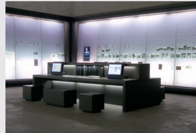
Vertiefungsbereich im Ausstellungsteil zum Konzentrationslager Bergen-Belsen