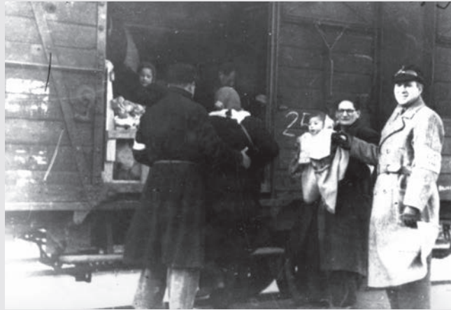
Am 19. Mai 1944 wurden 453 Juden und 245 Sinti und Roma aus Westerbork nach Auschwitz-Birkenau transportiert. Die SS ließ die Abfahrt des Zuges filmen. Mit demselben Zug verließen 238 Juden das niederländische Durchgangslager mit dem Ziel Bergen-Belsen.