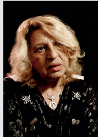
Ceija Stojka, geboren 1933, wurde 1945 im KZ Bergen-Belsen befreit. Sie berichtet in einer Medienstation über das „Zigeunerlager“ in Auschwitz-Birkenau.

„Dann kam die Auflösung, und es wurde aussortiert. Das heißt, die Arbeitsfähigen nach links, die anderen, die nicht arbeiteten, nach rechts. Die einen wurden für das Krematorium aussortiert, die anderen für die Arbeit. Mir hatte meine Mutter eingebläut zu sagen, ich sei 16 Jahre alt und könne gut arbeiten. [...] Erst hatten sie mich zu den anderen gestellt, aber dann kam ich wieder zurück. Da war eine liebe Polin, die leider ins Krematorium ging. Und meine beiden Tanten auch, wegen ihrer Kinder.“